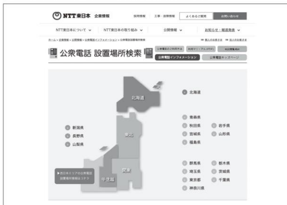
【図2】 公衆電話設置場所検索サイト（NTT東日本）*4

通信障害や災害が発生し、Webサイトで確認できない場合には、下記の公衆電話が設置されている可能性が高い場所を参考にして確認しておくとういでしょう。