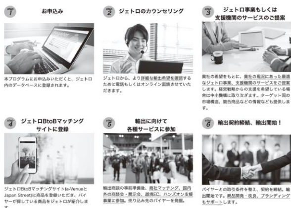
【図1】 輸出支援プログラムの流れ(イメージ)※2

商工会・商工会議所等とも協力しながら、①新たに輸出に挑戦する事業者の掘り起こし、②専門家による事前の輸出診断、③輸出用の商品開発や売込みにかかる費用への補助、④輸出商社とのマッチングやECサイト出展への支援などが一貫して実施されます。