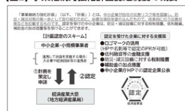
【図2】事業継続力強化計画認定制度の概要 ※5

事業継続力強化計画の具体的な策定方法については、事業継続力強化計画策定の手引きに記載されていますが、①事業継続力強化の目的の検討、②災害等のリスクの確認・認識、③初動対応の検討、④ヒト、モノ、カネ、情報への対応、⑤平時の推進体制を検討して計画に反映させていきます ※6 。